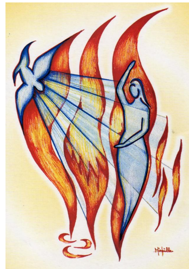
„Drei Flammen“ (Mireille Samir Chaker, Libanon)