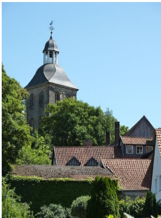
Turm der ev. Kirche in Tecklenburg mit Dächern von Fachwerkhäusern

Nähere Informationen folgen Ende 2018 unter anderem in unserem Newsletter, für den Sie sich unter www.kfd-muenster.de anmelden können.